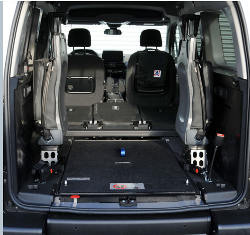
Mit der eingeklappten EASYFLEX Rampe kann der Kofferraum voll genutzt werden.