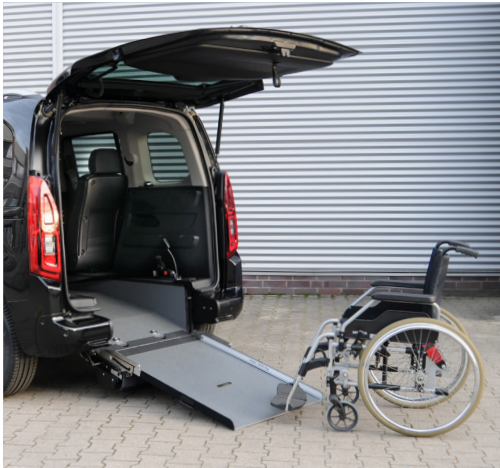
Bei ausgeklappter Rampe kann das Fahrzeug bequem mit dem Rollstuhl befahren werden.